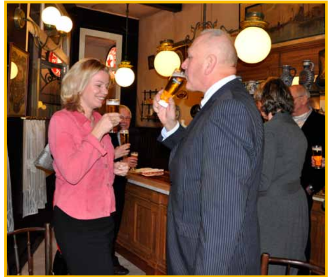
Een drank op het te verschijnen boek over Gerard Heineken in het nieuwe Heineken heritage cafe 'De Hooiberg'.

De inventarisatie van de audiovisuele collectie gaat door op drie fronten: inventarisatie van de video cassettes in het depot, invoer van de nieuwe acquisities (digitalisatie van bestaande films en video's), en inventarisatie van de films in depot bij NIBG (niet systematisch, alleen als er een kopie uitgenomen is om het te laten digitaliseren). In totaal zijn er 41 geheel nieuwe films / video's in de catalogoog toegevoegd, en 164 nieuwe dragers (kopieën van nieuwe of bestaande films/video's). Er is bijzondere aandacht gegeven aan films die van belang waren voor de productie van THE MAGIC OF HEINEKEN (films over het bedrijf en over Alfred Heineken).