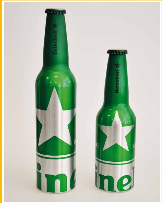
De aluminium Heineken STR-bottle werd geïntroduceerd in 2011. Onder 'black light' wordt een design met sterren en lijnen zichtbaar. Het flesje werd ontwikkeld door reclamebureau dBOD.