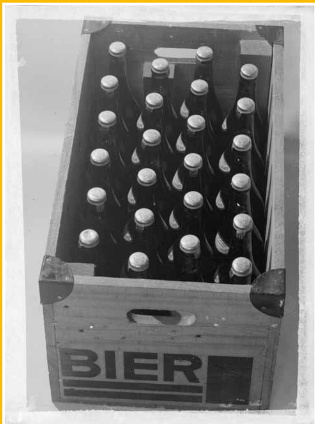
Uit de verzameling gedigitaliseerde glasnegatieven: de speciaal geconstrueerde HBM bierkist voor 24 flessen Heineken bier voor de binnenlandse markt, een vinding van een van de personeelsleden, 1931

thuishoren in de beeldbank van de Brand Collectie, worden overgeheveld naar de beeldbank. In TMS wordt de herkomst uit het archief genoteerd, in het archiefoverzicht wordt verwezen naar de beeldbank [met objectnummer]. Er werd ca. 11 meter aan financiële boekdelen geïntroduceerd en 1.60 meter van de losse, ongeordende documenten [voorlopige inventarisnr. 1 t/m 122]. Het totaal van het archief wordt geschat op ca. 25 meter. De archiefstukken kregen tegelijkertijd de nodige materiele verzorging. Na afronding van de inventarisatie zal het archief worden overgedragen aan het Sociaal Historisch Centrum voor Limburg in Maastricht. Ook bij Brand werd er voor gekozen om naast het archiveren, heel gericht enkele afgeronde beeldcollecties te registreren in de database TMS. In totaal werden 236 grotendeels wat oudere zwart wit foto's geregistreerd, vooral foto's van de gebouwen en de inrichting van de brouwerij. Daarnaast werden een collectie bierflesetiketten en nieuwe aanwinsten geregistreerd en gefotografeerd. Nieuwe aanwinsten bestaan grotendeels uit nieuw uitgekomen glazen, verpakkingen en reclameuitingen rond het vernieuwde Brand logo en het nieuwe Brand Weizen. In totaal werden 617 Brand objecten toegevoegd aan de database.