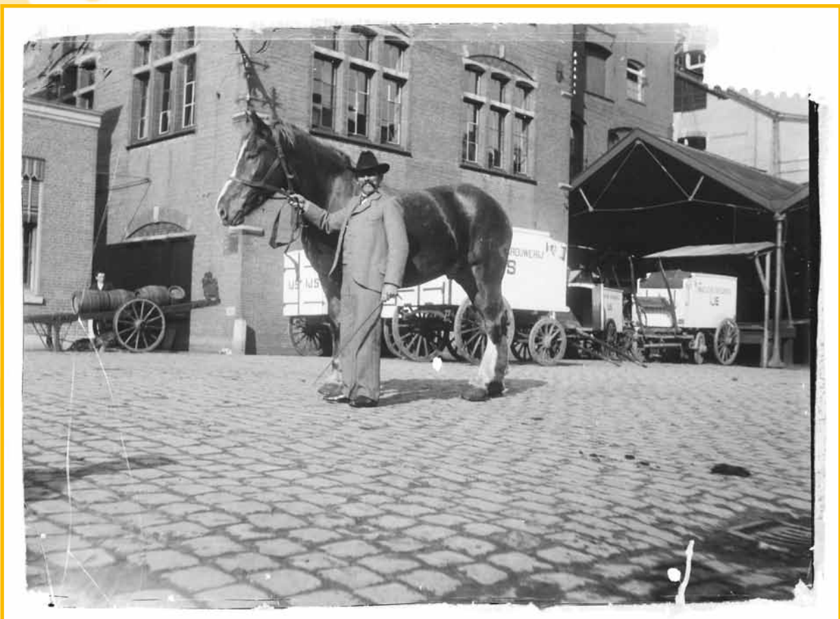
Uit de verzameling gedigitaliseerde glasnegatieven: koetsier met paard op de binnenplaats van de brouwerij in Rotterdam, ca 1920

Als kenniscentrum voor de brouwerijgeschiedenis vervult de Stichting Heineken Collection een belangrijke rol in de maatschappij. Zij dient als bron van kennis en informatie voor instellingen en particulieren met betrekking tot de geschiedenis van het bier in Nederland en de merken die in het Heineken concern zijn opgegaan.