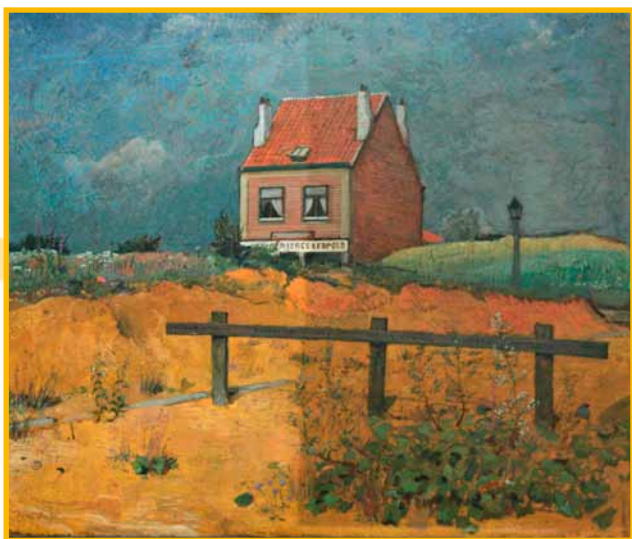
'Bières Leopold'; landschap bij Oudergem, H.H. Kamerlingh Onnes, ca. 1930; opname tijdens restauratie

Zoals gezegd werden 2781 records toegevoegd aan de collectie database, waardoor de hierin beschreven objecten onderdeel werden van de Heineken Collection. Het grootste deel van de objecten bevond zich reeds ongeïventariseerd in de depots. 186 voorwerpen zijn in 2010 geregistreerd als schenkingen. Dit betreft voornamelijk schenkingen uit het Heineken-concern zelf of van (oud-)medewerkers.