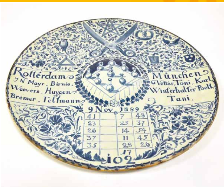
Gedenkbord kegelwedstrijd Heineken Brouwerij Rotterdam 1889, De Porcelaine Fles, Delft; ontwerp G. Seidl